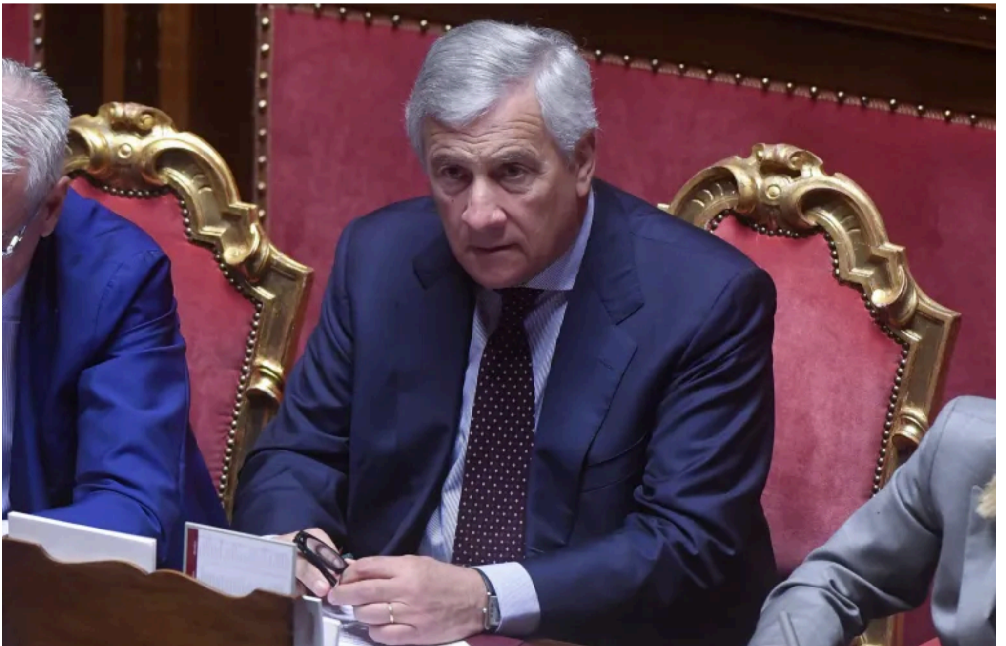
Il ministro degli Esteri, Antonio Tajani

Interpellato in Senato dopo la pubblicazione dell'inchiesta di Altreconomia, il vicepresidente del Consiglio ha evitato di chiarire le motivazioni che hanno spinto l'Italia, nel 2024, a iniziare in maniera massiccia e inedita le esportazioni di materiale impiegabile nella produzione di esplosivi dopo l'inizio dell'operazione "Spade di Ferro" e ha anche fornito dichiarazioni distorte sulla loro legittimità. Ecco perché