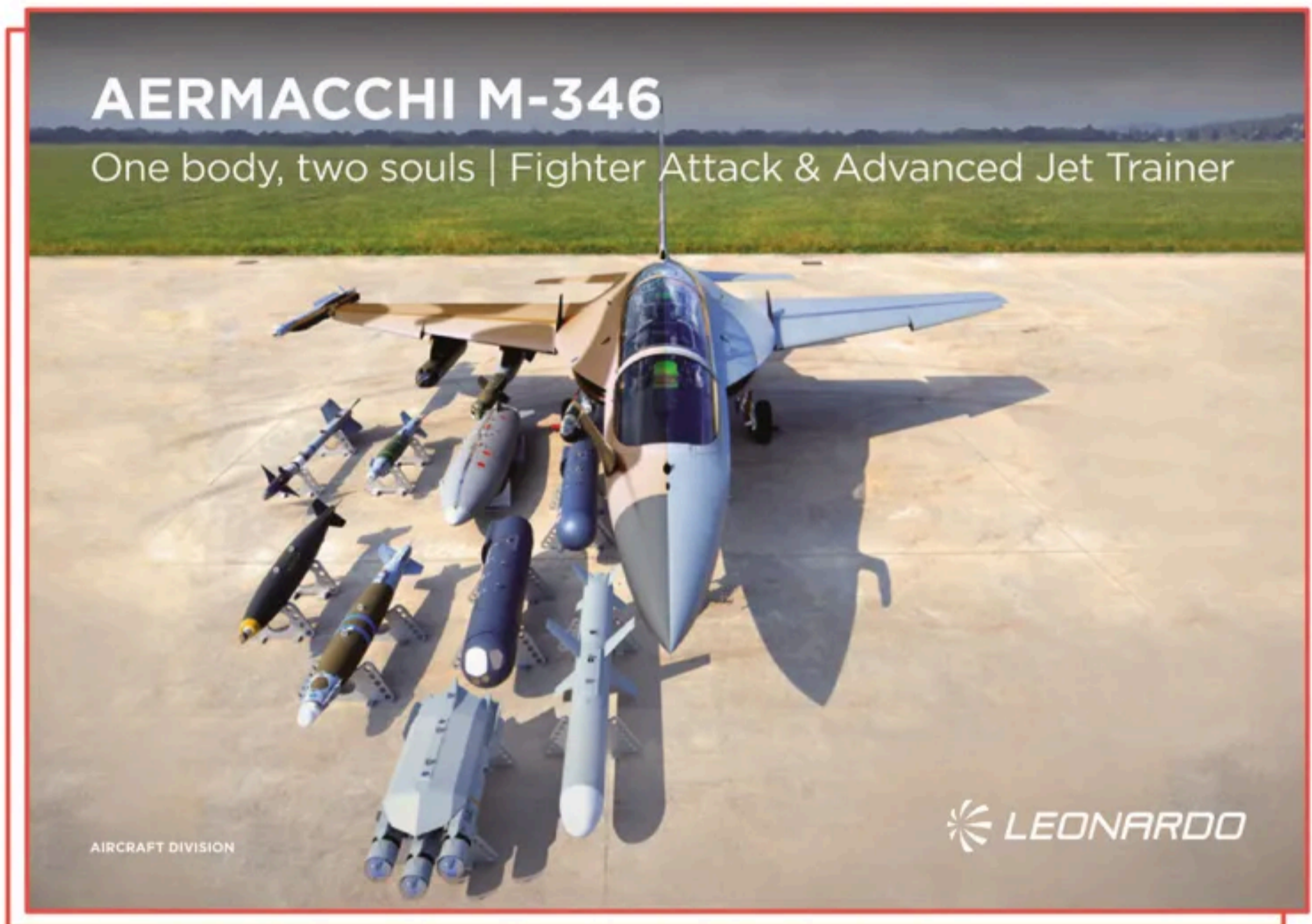
Il frontespizio della brochure commerciale del velivolo M-346 realizzato da Alenia Aermacchi, controllata da Leonardo. “Un corpo, due anime”: caccia d’attacco o addestratore avanzato

in questi casi è sempre la valutazione effettuata caso per caso, in linea con la normativa italiana, con quella europea (Posizione comune Ue 944 del 2008) e con quella internazionale ( Arms trade treaty ), per verificare se il materiale o la tecnologia in oggetto possano, o meno, essere impiegati ai danni della popolazione civile”. Nel caso di specie, sostiene il ministero degli Esteri, “questo rischio non sussiste, trattandosi di materiale residuale relativo ad una commessa di aerei da addestramento, già consegnati da tempo. Dopo il 7 ottobre, analoga valutazione è stata effettuata in maniera approfondita su tutte le licenze residue ancora aperte nei confronti di Israele”.